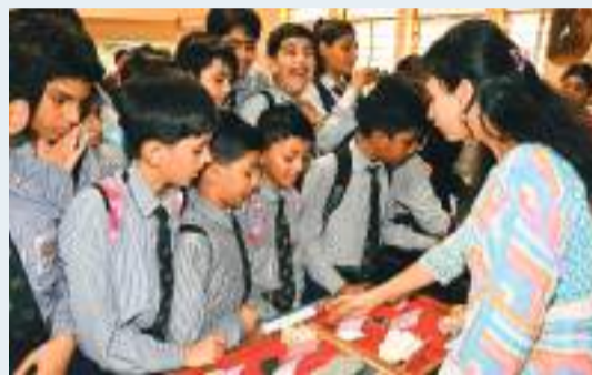
शेल्टर, चंबल के बीहड़, दाला उल्कापिंड प्रभाव क्रेटर, घुसुआ राष्ट्रीय जीवाश्म पार्क और मझगांव हीरा खदान आदि एमपी के भूवैज्ञानिक महत्व के कुछ अमोक्ष्य स्थलों की झलक दिखाई गई। इसके अतिरिक्त प्रदर्शनी में एमपी में पाए जाने वाले दुर्लभ खनिज नमूने, रॉक नमूने और जीवाश्म भी प्रदर्शित किए गए। कार्यक्रम का लाम स्कूल, कॉलेज के विद्यार्थियों सहित कुल 600 आम दर्शकों ने उठाया।