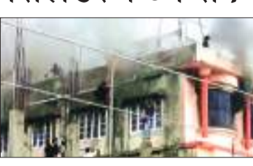
एजेसी ॥ श्री मुक्तसर साहिब

मुक्तसर के गिड़वाहा में डेरा सिद्ध बाबा गंगा राम में चल रहे बरसी समागम दौरान सिलेंडर फट जाने से डेरे के 7 सेवादर झुलसे गए। घायलों को सिविल व निजी अस्पताल में भर्ती करवाया गया। यहां से 5 को बर्तिका रेफर कर दिया गया है। डॉ. राजीव जैन के मुताबिक बर्तिका रेफर किए गए 5 में तीन सेवादर 60-70 फीसद झुलसे हैं। धमाके की आवाज सुन कर श्रद्धालु भयभीत हो गए और अफरा-तफरी मच गई।