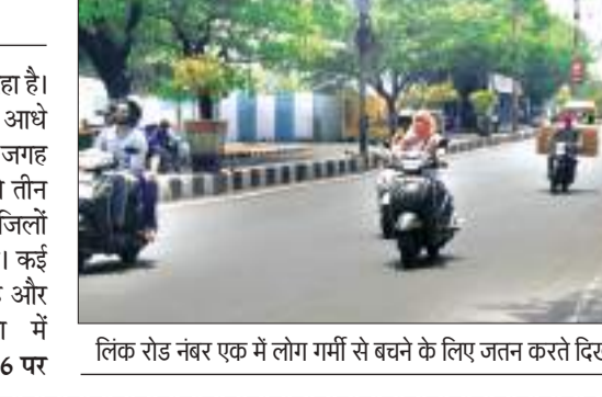
लिक रोड नंबर एक में लोग गर्मी से बचने के लिए जतन करते दिखे।

दतिया में पारा 47 डिग्री पार, जबकि आधा दर्जन जिलों में पारा 43 से 44 डिग्री के करीब रहा