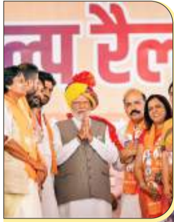
अंबाला

पीएम नरेंद्र मोदी ने हरियाणा के अंबाला जिले में शनिवार को जनसभा को संबोधित करते हुए कांग्रेस समेत विपक्ष पर जमकर निशाना साधा। पीएम ने कहा कि हरियाणा वो राज्य है जिसके रांगों में देशभक्ति है और वो देश को तोड़ने वाली शक्तियों को अच्छी तरह पहचानते हैं। हरियाणा मतलब धाकड़ होता है और मोदी ने भी 10 साल तक धाकड़ सरकार चलाई है। पाकिस्तान 70 वर्षों से भारत को परेशान कर रहा था, जिसके हाथ में बम का गोला रहता था, आज उसके हाथ में भीख का कटोरा है। जब धाकड़ सरकार होती है, तो ऐसे ही दुश्मन कांपता है। 4 चरणों के चुनाव में कांग्रेस और इंडी गठबंधन के सभी साथी चारों खाने चित्त हो चुके हैं। कांग्रेसी विदेश से हथियार मंगाने के नाम पर मोटी कमाई कर सके। हमारे सैनिकों को कपड़े, जूते, बुलेट प्रूफ जैकेट भी ठीक से नसीब नहीं होते थे। उनके पास अच्छी राइफल तक नहीं थीं। मैंने भारत की सेनाओं को आत्मनिर्भर बनाया। आज भारत अब दूसरे देशों को हथियार बेच रहा है।