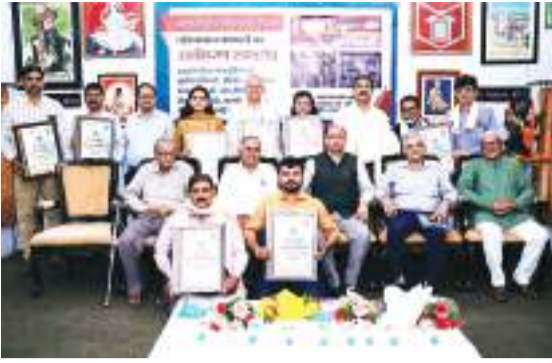
ने भी मुद्रित माध्यम का महत्व बताते हुए कहा कि हमें यदि विस्तार से खबरें चाहिए तो उसकी जरूरत केवल प्रिंट मीडिया ही पूरी कर सकता है। आम आदमी के दिनचर्या की शुरुआत भी समाचार-पत्र से होती है।