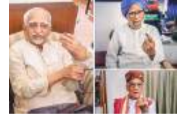
राहुल गांधी, स्मृति ईरानी, दिनेश प्रताप सहित कई दिग्गजों के भाग्य का होगा फैसला