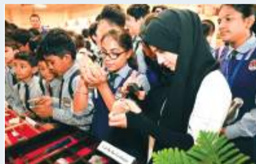
भोपाल। शिक्षा, अनुसंधान के विकास तथा सामाजिक प्रगति के दर्पण के रूप में संग्रहालयों की भूमिका के बारे में जागरूकता पैदा करने के उद्देश्य से आंचलिक विज्ञान केंद्र, भारतीय भूवैज्ञानिक सर्वेक्षण के सहयोग से अंतरराष्ट्रीय संग्रहालय दिवस समारोह का आयोजन किया गया। कार्यक्रम अंतर्गत, एमपी के भू-पर्यटन स्थल विषय पर केंद्रित एक अस्थाई प्रदर्शनी जिसमें भेड़घाट-लम्हेटाघाट, भीमबेटका रॉक