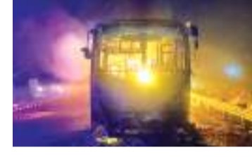
एजेसी | नूंह

हरियाणा के नूंह में टूरिस्ट बस में आग लगने से बड़ा हादसा हो गया। यह हादसा कुडली मानेसर पलवल एक्सप्रेसवे पर हुआ। बस में करीब 60 लोग सवार थे, जिसमें से 9 लोगों की मौत हो गई और 24 लोग घायल हो